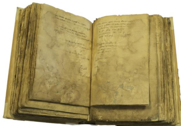
Rekeningen Kerkmeesters Jacobikerk Utrecht; 16e eeuw.